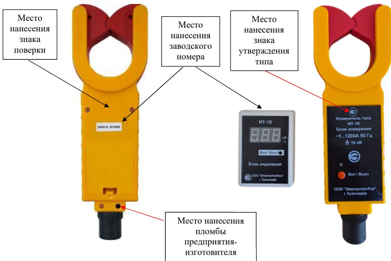
Рисунок 1 – Общий вид измерителей с указанием места ограничения доступа к местам настройки (регулировки), места нанесения знака утверждения типа, места нанесения заводского номера